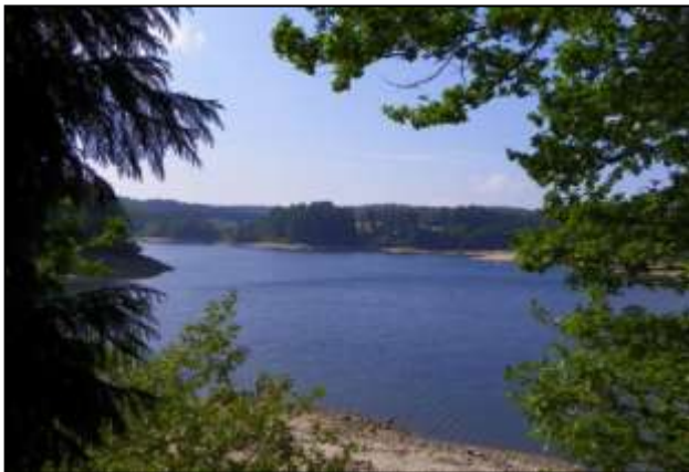
Lac des St Peyres